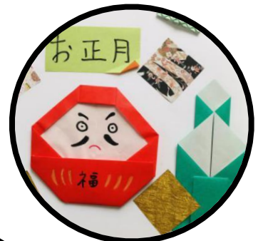
かどまつ ダルマと門松