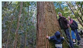
近くの森でのブッシュウォーキング ホストマザーは森の植物や坂道の入り方などたくさん教えてくれました。