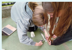
Korowal School で友達はフレンドリーでやさしく、生徒は積極的に授業に参加していました。