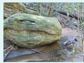
恐竜のような石 ホストマザーのお気に入りです。