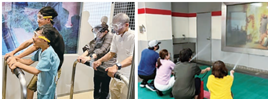
風速32mの強風体験 必死でバーを握っています