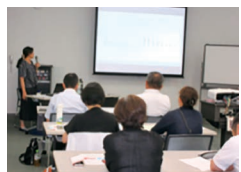
小学校教頭研修 (8月8日)