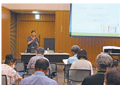
生涯学習カレッジ「三田在住の外国人の文化の多様性を知ろう」(8月8日)