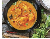
Sweetwater Fish Curry

牛乳にレモン汁を入れて固めたとても甘いロソゴラ(Rosogolla)と魚のカレーが有名です。魚は湖などにいる淡水魚(Sweetwater fish)を使います。