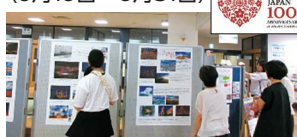
日・トルコ外交関係樹立100周年事業