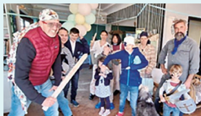
誕生日パーティー 大勢の親戚がコスプレをして集まり、誕生日の人の好きなところを言います。