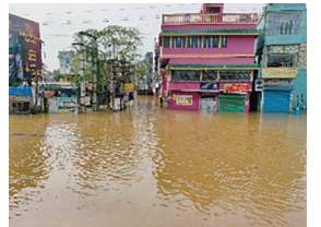
雨期の街 学校も休みです