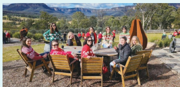
南半球ではクリスマスは真夏になるため、冬のこの時期「クリスマスインジュライ」というクリスマスパーティーを開きます。