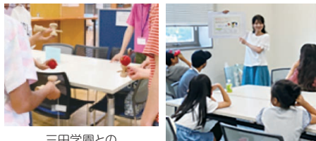
三田学園との交流プログラム