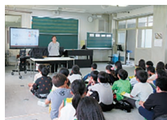
三輪小5年生「外国の方と仲良くなろう」(5月20日)